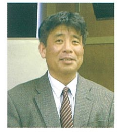
著者：大場 真人 (カナダ アルバータ大学農学部 乳牛栄養学・教授)